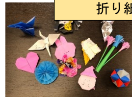
児童メッセージ 折り紙

今年度は2日間実施して、458人の75歳以上の高齢者の方へ地域通貨券、幡東小児童メッセージ折り紙および企業協賛品を配付し、併せて会場内に設置した喫茶サロンで、お茶を飲みながらくつろいでいただきました。