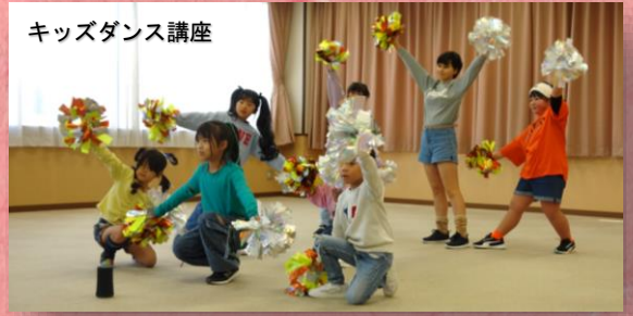
キッズダンス講座