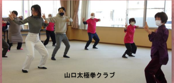
山口太極拳クラブ