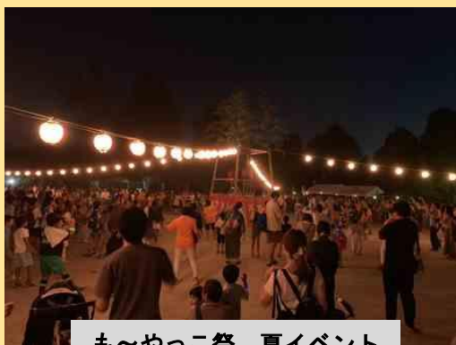
も～やっこ祭 夏イベント