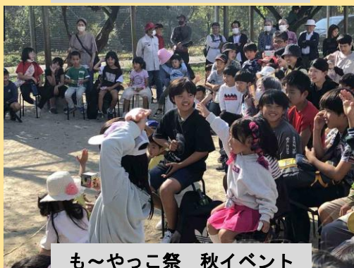
も～やっこ祭 秋イベント