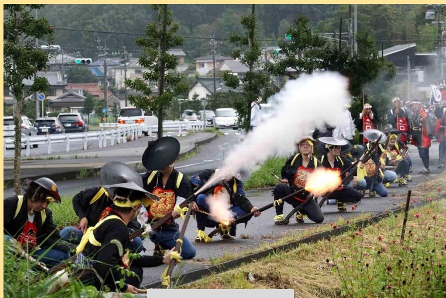
山口八幡社秋祭り