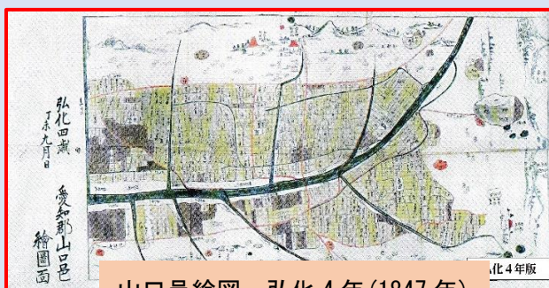
山口邑絵図 弘化4年(1847年)