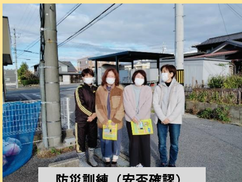
防災訓練（安否確認）