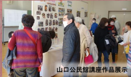
山口公民館講座作品展示