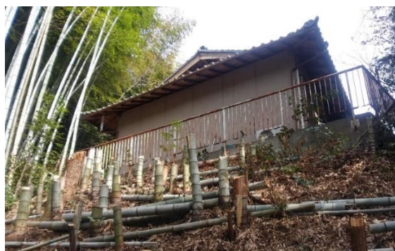
屋敷回りの孟宗竹伐採