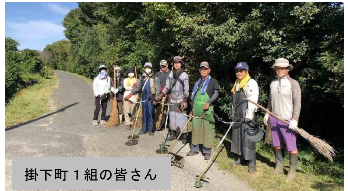
掛下町1組の皆さん