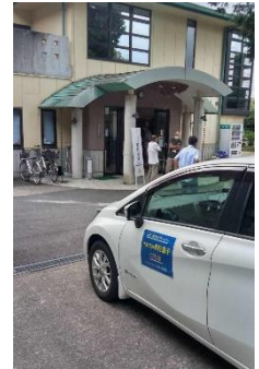
「やまぐちの孝行息子」車両の送迎

尽きぬ話題、同じ山口に住みながらも久しぶりの旧友との再会などで長時間滞在される方もあり、この機会を満足されたように皆さん一様に笑顔でお帰り頂きました。