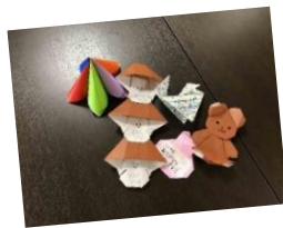
児童メッセージ折り紙