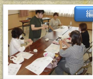
編み物はじめてみませんか

場所を取らず、かぎ針と毛糸があれば、すぐに始められます。思い思いの作品を作ることが出来ました。