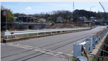
写真③ 現在の屋戸橋

古くは瀬戸の窯業の燃料として伐り出されてはげ山となってしまった海上の森の植林事業、また治水や農業用水確保のための山口堰堤や海上砂防池の建設など、山口地域の多くの先人達が汗水を流しました。