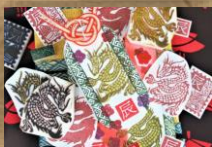
干支の消しゴムはんこで正月飾りを作ろう

干支の消しゴムはんこ作りに挑戦し、手作りのハンコをつくりませんか。専門家の先生が優しく丁寧に教えてくれます。この機会に消しゴムはんこ作りの楽しさを体験してみませんか。