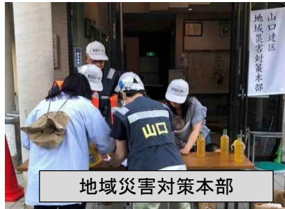
地域災害対策本部