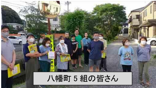
八幡町 5 組の皆さん

この訓練と並行して、防火防災委員による町区域の情報収集と火災警戒訓練を実施し、地域災害対策本部では集結した防災リーダーによる地域被害状況調査および情報集約訓練、現場資機材取り扱い訓練を展開しました。