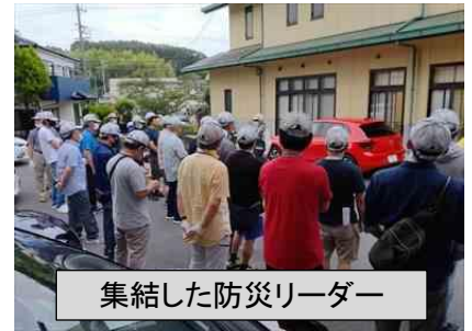
集結した防災リーダー