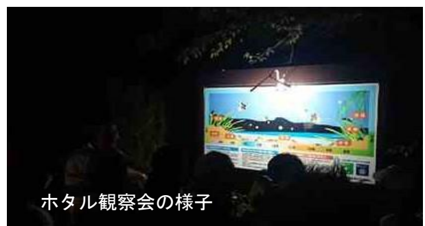
ホタル観察会の様子