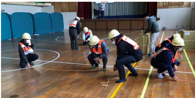
避難所の居住区画設営