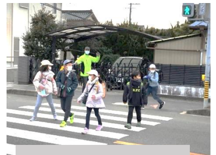
小学生の登校見守り

青パト委員会では、地域の安全・安心を目指して、平日の朝と昼の部は小学生の登下校の交通安全監視を行い、夜の部は地域の防犯パトロールをしています。しかし隊員自体が高齢化で減少し乗務シフトが組めない日も発生しています。