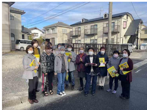
池田町6組の皆さん

参加率はただの目安であり、いつか起きる地震災害に、このシステムを有効に稼働させることが最も重要と考えます。不備は修正しつつ、来期以降もこの訓練を継続実施する予定です。