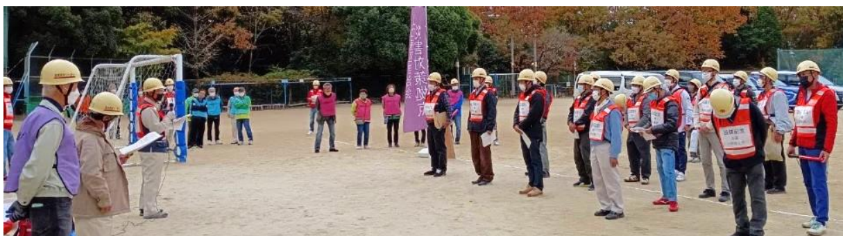
防災リーダーがグラウンドに集結

安否確認は、安否札を掲げた世帯の数を単に数えることではなく、まず組区域の人が一か所に集合し相談して、区域の中で安否札を掲げていない世帯を訪問、必要ならば避難行動を補助していただくことが本旨です。～～組区域を組住民で守る～～