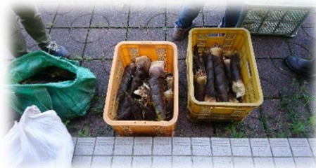
たくさん掘れました