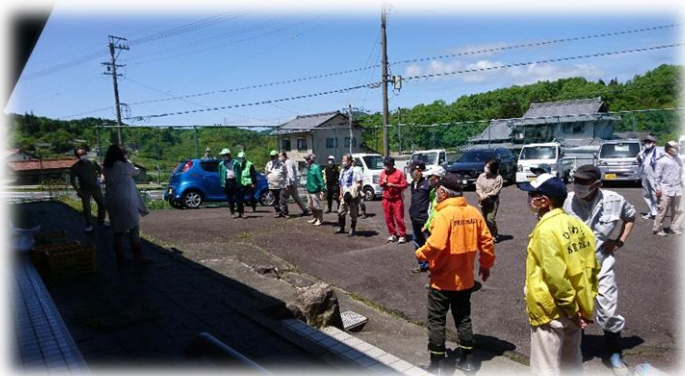
さあ、掘りに行きましょう！

コロナ禍で3年「筍まつり」を行っていません。少人数での交流であれば行えるのではないかと、考えれば何か次が見えて来るのではないのでしょうか。