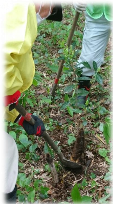
うまく掘れるかな？