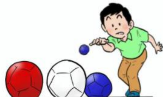
ニュースポーツ教室 (ポッチャ等)