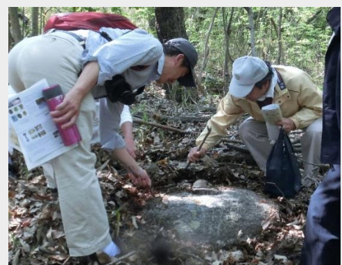
お鋏さんに移転した礎石