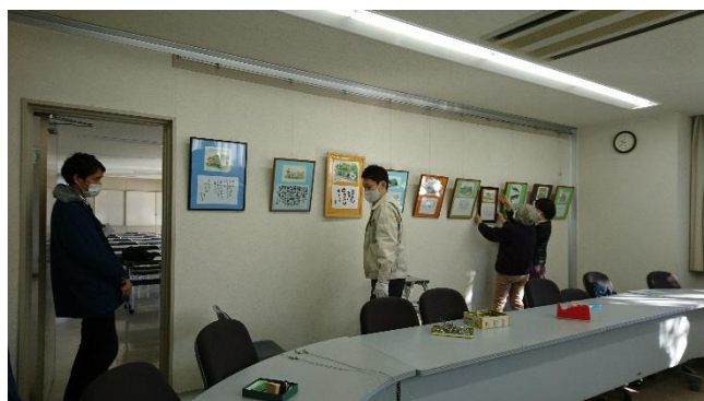
水野地域交流センター