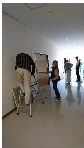
品野台地域交流センター