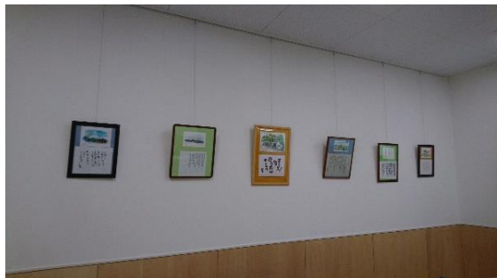
下品野地域交流センター

ー昨年10月パーティセとで「山渡る風」原画展を行い、皆さまに好評いただきました。