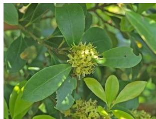
モチノキ 瀬戸の名木 80 定光寺参道の西側林内、市内最大