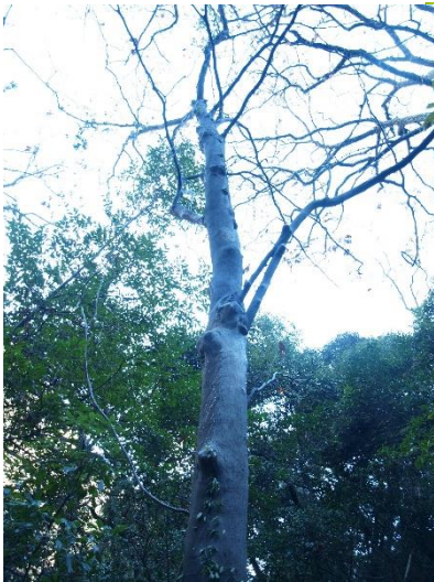
ハクウンボク 瀬戸の名木 88 応夢山北斜面に自生