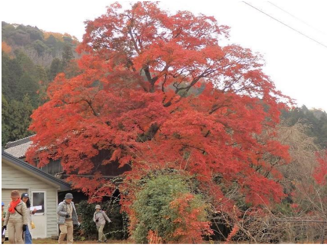
イロハモミジ 瀬戸の名木 74 松本家の庭