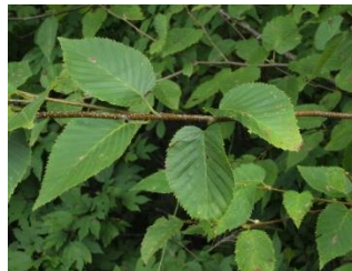
アサダ 瀬戸の名木 60 蛇ヶ洞川と庄内川の合流付近、市内では稀な樹木